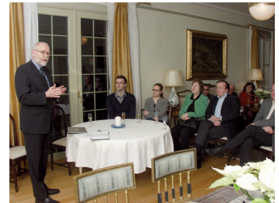
(Anttonen 1) Medlemmer i Norsk Finsk handelsforening fikk presentert det ubyråkratiske samarbeidet «Team Finland».

Forholdet til Russland er avhengig av oljeprisen. Finland importerer all olje og gass, samt det meste av kullet landet trenger, fra Russland. Dette er en helt naturlig handel. Usikkerhetsmomentet